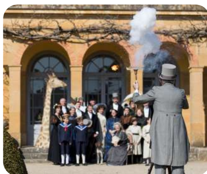
1900 Château de Digoine 2ème édition juin 2023 14.500 spectateurs 600 volontaires