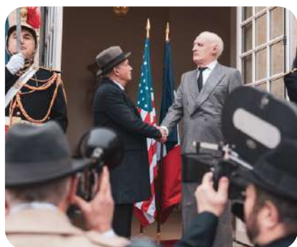
Secret Défense Château de Rambouillet 2ème édition juin 2023 18.000 spectateurs 600 volontaires