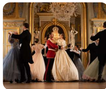
La Belle et la Bête Tournée multi sites 2ème édition à Maisons en 2023 40.000 spectateurs 600 volontaires