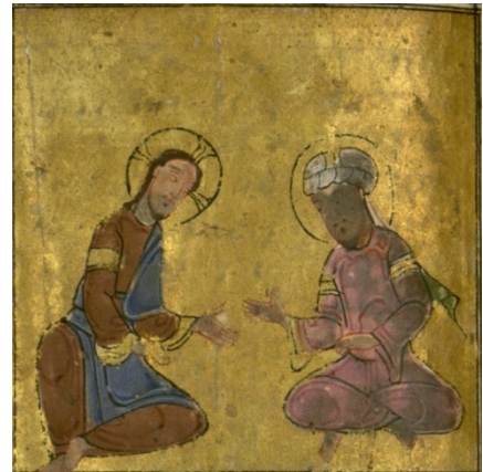
La rencontre de Jésus avec Nicodème

Préparons-nous à l'écoute de l'Évangile (Grégoire de Narek, moine mystique arménien du X e siècle) : Seigneur, quand le bruit du quotidien nous empêche d'entendre ta voix, quand le bruit de nos soucis couvre tes paroles d'espérance, quand le tumulte de la vie semble nous emporter, éveille nos cœurs à ta Parole. Éveille nos cœurs à la Parole que nous allons entendre maintenant, qu'elle soit notre nourriture, celle qui nous permet d'avancer et de toujours espérer. Amen.